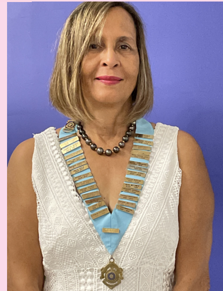
Régine FOCK-LAPP Gouverneur D920