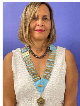
Régine FOCK-LAPP Gouverneur D920 Réunion & Madagascar