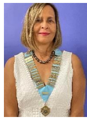
GOUVERNEUR D920 Régine FOCK-LAPP