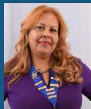
PRÉSIDENTE IIV CLUB SAINT-DENIS VANILLE