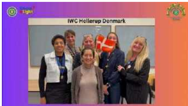
Centenary Wishes for Inner Wheel in different languages from around the Globe: Video 4 youtube.com

Merci à Sonia et sa fille pour le montage !