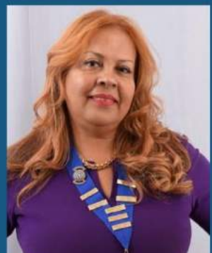
PRÉSIDENTE IW CLUB SAINT-DENIS VANILLE