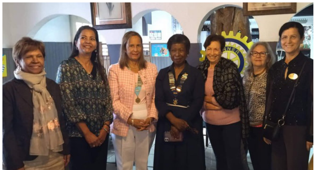
IWC SAINT-BENOÎT/SAINT ANDRE