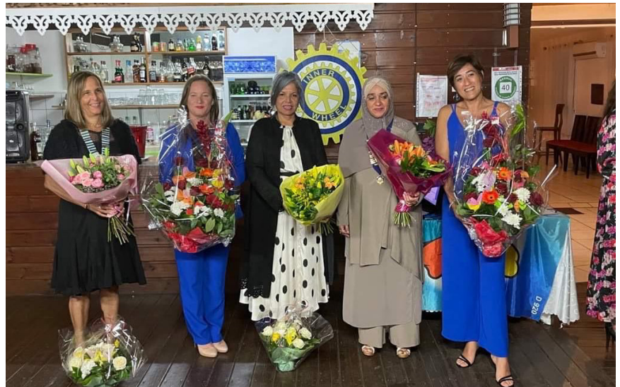
IWC TAMPON SAINT-PIERRE et ESPERANCE 920