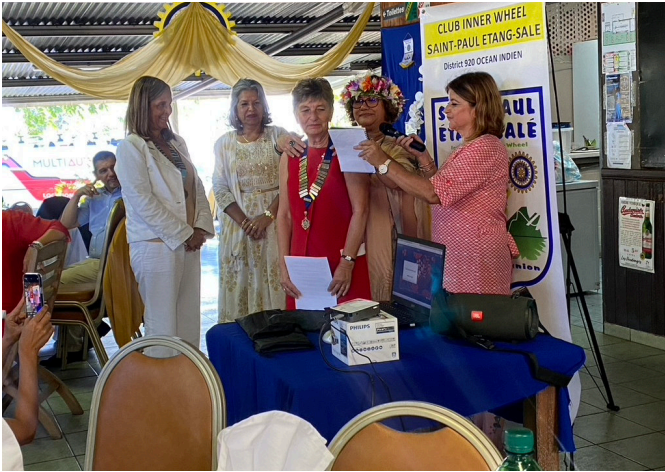
IWC SAINT-PAUL/ETANG SALE