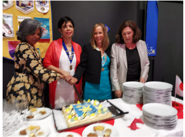
IWC SAINT-DENIS VANILLE