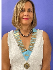
GOUVERNEUR D920 Régine FOCK-LAPP