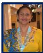
IMMEDIAT PAST GOUVERNEUR GLORIA