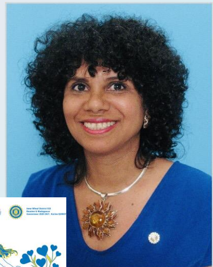
Gouverneur D 920