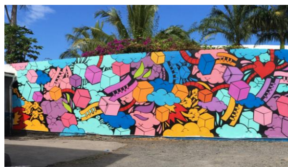
Exemple du travail artistique de VAST