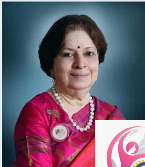
International Inner Wheel President