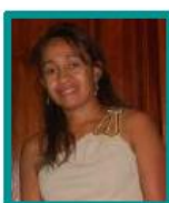
RELATIONS INTERNATIONALES KATIUSCIA