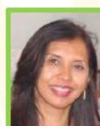
ÉDITRICE - MEDIA MANAGER MEVA