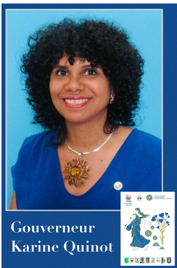
Gouverneur Karine Quinot