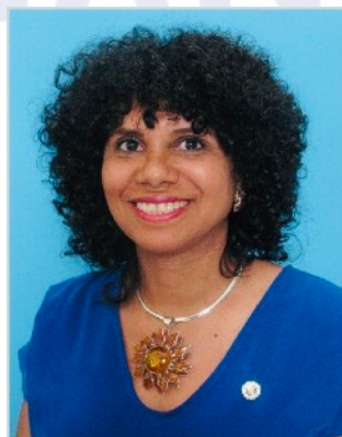
KARINE QUINOT GOUVERNEUR