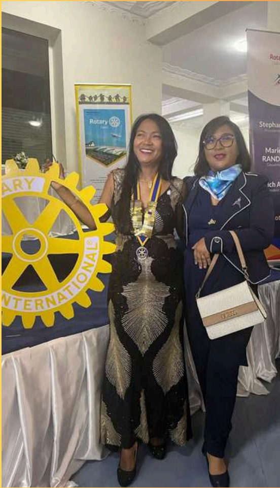
11 Juin Passation Rotary Club IVATO