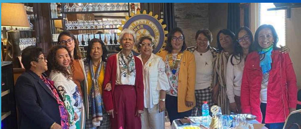
Membres Inner Wheels présents