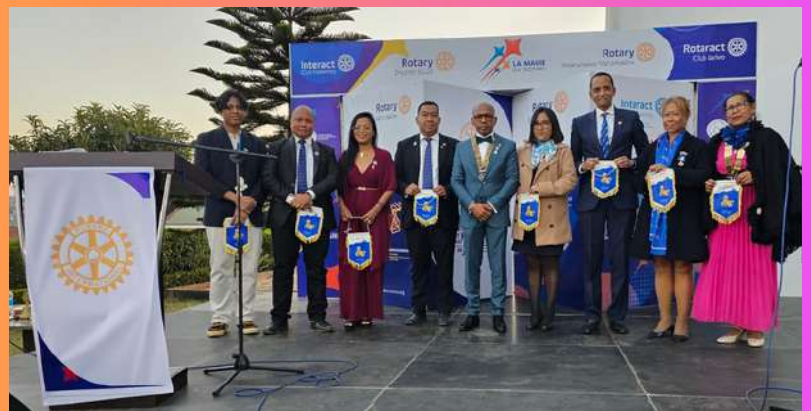
07 Juillet Passation Rotary Club MAHAMASINA