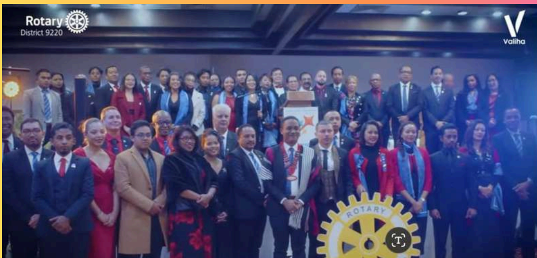
30 Juin Passation District du Rotary 9220