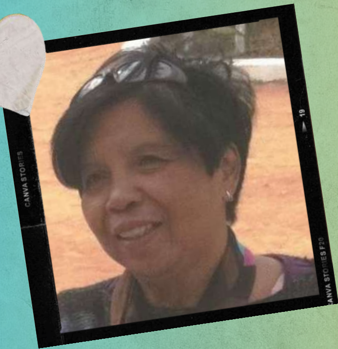
Solange 9 juillet