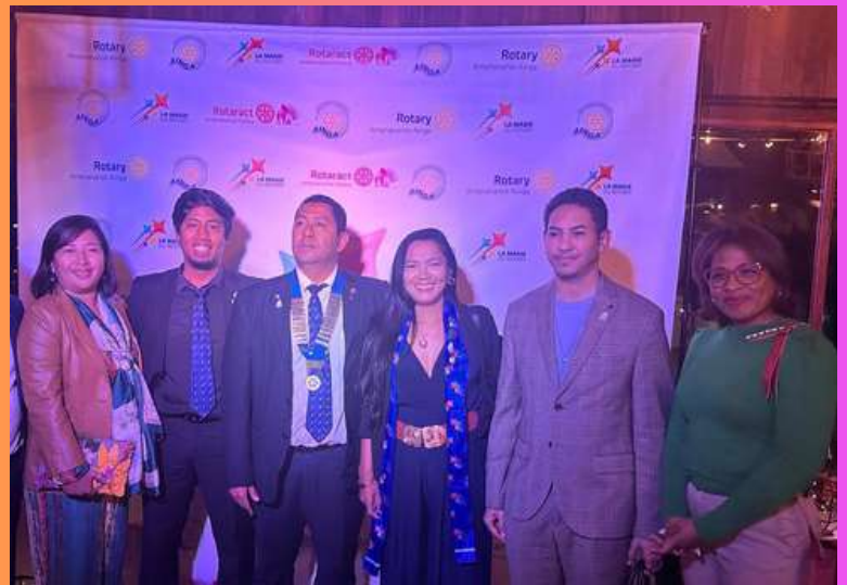
15 Juin Passation Rotary Club Ainga