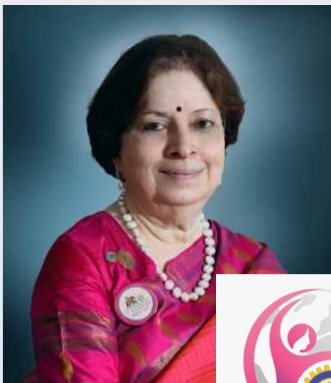
International Inner Wheel President