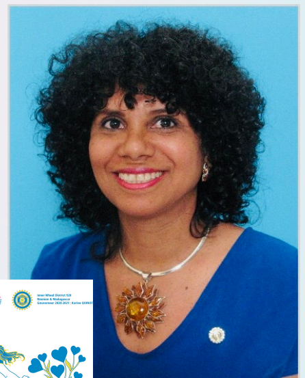
Gouverneur D 920