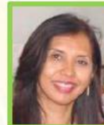
ÉDITRICE - MEDIA MANAGER MEVA