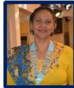
IMMEDIAT PAST GOUVERNEUR GLORIA