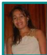
RELATIONS INTERNATIONALES KATIUSCIA