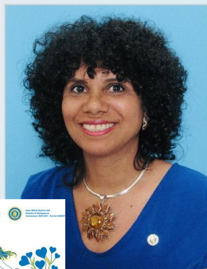
Gouverneur D 920